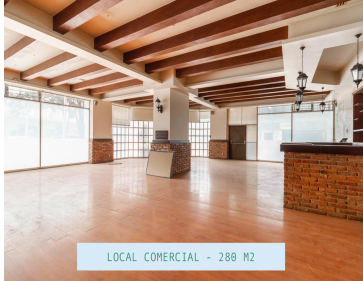
LOCAL COMERCIAL - 280 M2