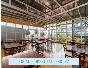
LOCAL COMERCIAL 280 M2