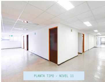
PLANTA TIPO - NIVEL 11