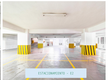
ESTACIONAMIENTO - E2