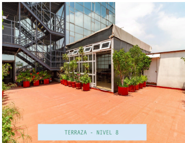
TERRAZA - NIVEL 8