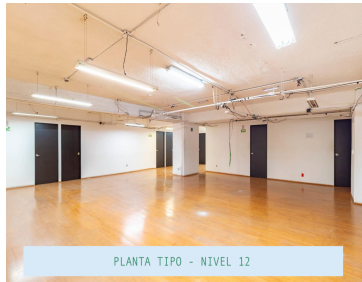
PLANTA TIPO - NIVEL 12