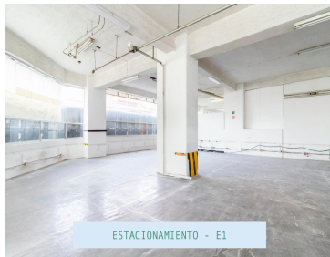
ESTACIONAMIENTO - E1