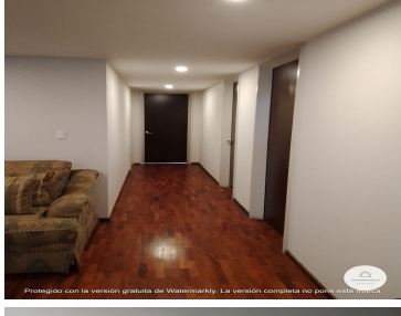
Protegido con la versión gratuita de Watermarkly. La versión completa no pone esta marca.