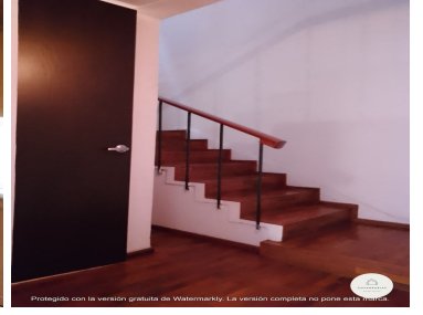
Protegido con la versión gratuita de Watermarkly. La versión completa no pone esta marca.