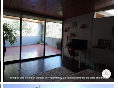
Protegido con la versión gratuita de Watermarkly. La versión completa no pone esta marca.