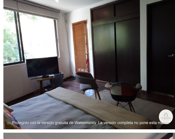
Protegido con la versión gratuita de Watermarkly. La versión completa no pone esta marca.