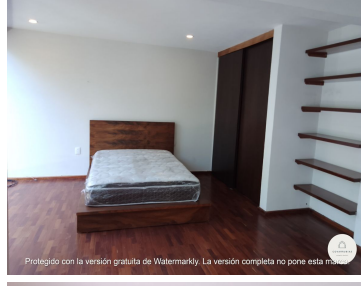
Protegido con la versión gratuita de Watermarkly. La versión completa no pone esta marca.