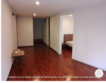
Protegido con la versión gratuita de Watermarkly. La versión completa no pone esta marca.