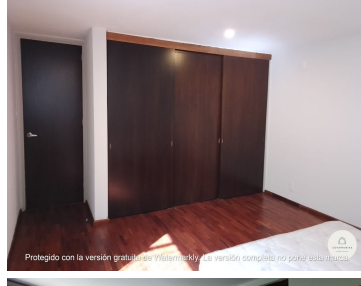
Protegido con la versión gratuita de Watermarkly. La versión completa no pone esta marca.