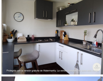
Protegido con la versión gratuita de Watermarkly. La versión completa no pone esta marca.