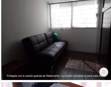
Protegido con la versión gratuita de Watermarkly. La versión completa no pone esta marca.