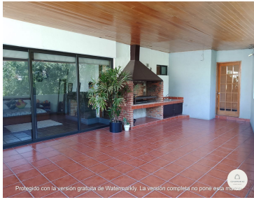
Protegido con la versión gratuita de Watermarkly. La versión completa no pone esta marca.