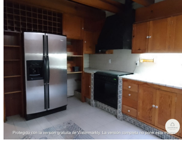
Protegido con la versión gratuita de Watermarkly. La versión completa no pone esta marca.