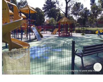
Protegido con la versión gratuita de Watermarkly. La versión completa no pone esta marca.