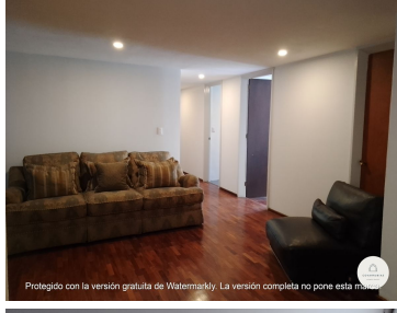
Protegido con la versión gratuita de Watermarkly. La versión completa no pone esta marca.