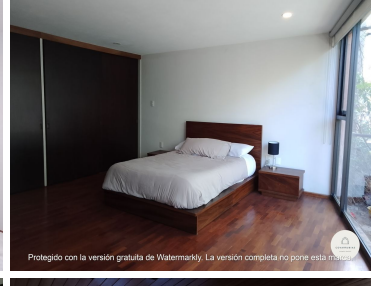
Protegido con la versión gratuita de Watermarkly. La versión completa no pone esta marca.