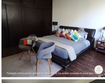
Protegido con la versión gratuita de Watermarkly. La versión completa no pone esta marca.