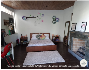
Protegido con la versión gratuita de Watermarkly. La versión completa no pone esta marca.