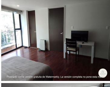
Protegido con la versión gratuita de Watermarkly. La versión completa no pone esta marca.