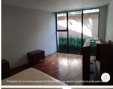
Protegido con la versión gratuita de Watermarkly. La versión completa no pone esta marca.