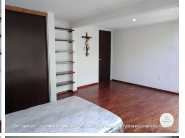
Protegido con la versión gratuita de Watermarkly. La versión completa no pone esta marca.