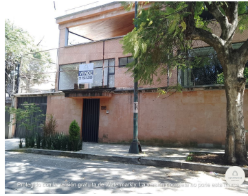
Protegido con la versión gratuita de Watermarkly. La versión completa no pone esta marca.