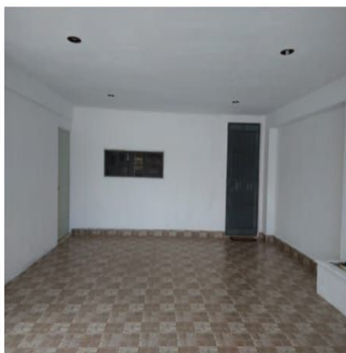
GARAGE PARA DOS AUTOS