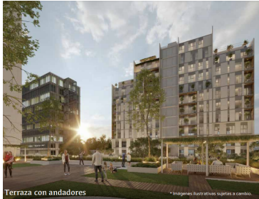
Terraza con andadores