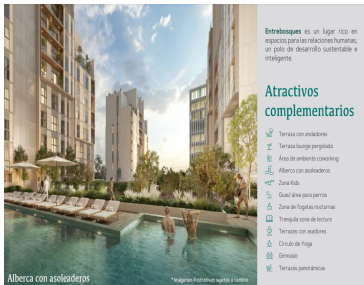
Alberca con acoleadero