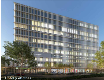
Hotel y oficinas