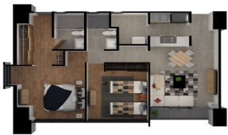
3 RECÁMARAS — 118 M 2