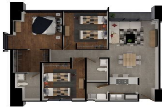
PH3 — 158 M 2