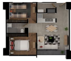
PH1 — 118 M 2