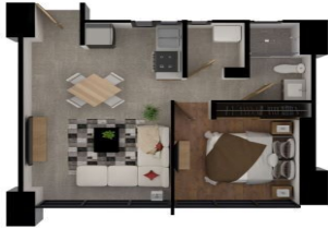
2 RECÁMARAS — 98 M 2