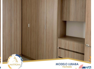
MODELO LUBABA Facturado