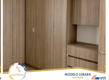
MODELO LUBABA Facturado