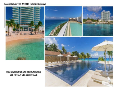
Beach Club in THE WESTIN Hotel All Inclusive