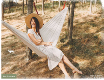
Área de hamacas