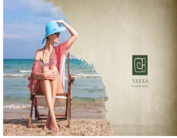
YAKKA CLUB DE PLAYA