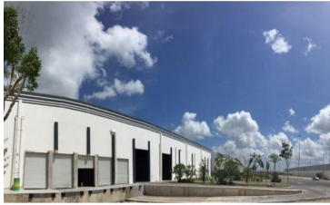
- IMAGEN EXTERIOR -