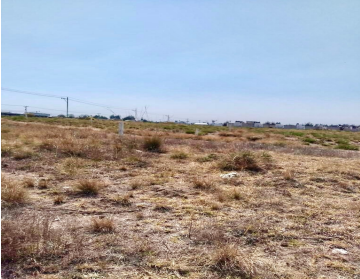
TRAMO DE CALLES, CALLES TRANSVERSALES, LÍMITES Y ORIENTACIÓN