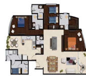
Tipo 1 & 2 201-C, 202-C, 201-D, 301-C, 301-D, 302-C, 302-D, 401-D, 402-D