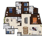
Tipo PH PH-2-B, PH-1-C PH-2-C, PH-1-D PH-2-D, PH-1-E