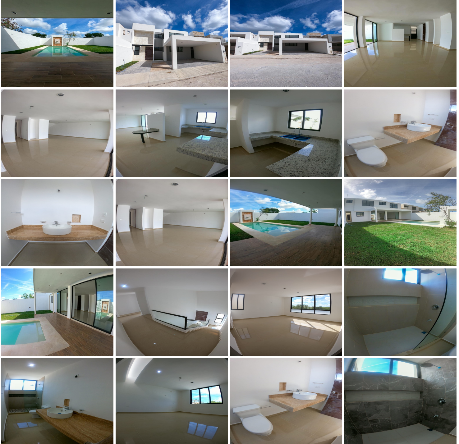
PLANTA BAJA MODELO 4