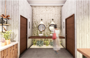
ÁREA DE BAÑOS