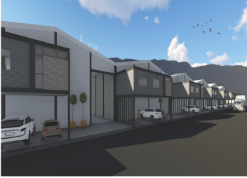
BOGAS | Tipo A 100 m 2