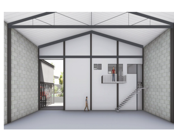
VISTA INTERIOR | Buen valor desde las oficinas hacia el área de trabajo.