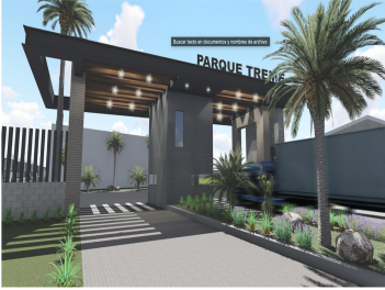
CADETA DE ACCESO | Futuro y presente con acceso controlado