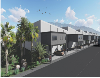
BOVEDAS | Tipo A 430 m 2