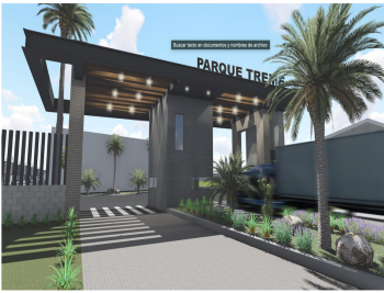
CADETA DE ACCESO | Autos y peatrones con acceso controlado