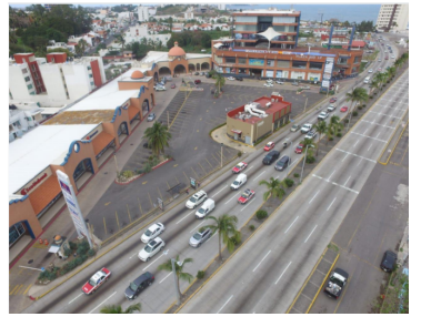
ZONA DE INFLUENCIA COMERCIAL MUNICIPIOS DE BOCA DEL RIO, MEDELLIN Y ALVARADO