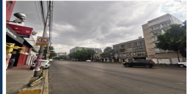
FOTOS DEL ÁREA