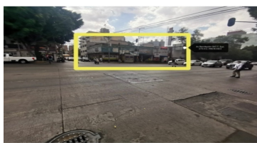
FACHADA CON DOS FRENTE DE 19MTS. SOBRE AV. REVOLUCIÓN Y CALLE 10.