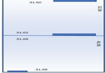
MEDIDAS DE LAS DOS NAVES