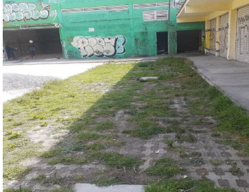
AREA DONDE SE ENCUENTRA LA CISTERNA