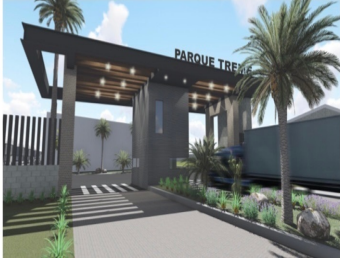
CAJETA DE ACCESO | Áreas y pastores con acceso controlado