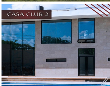
CASA CLUB 2