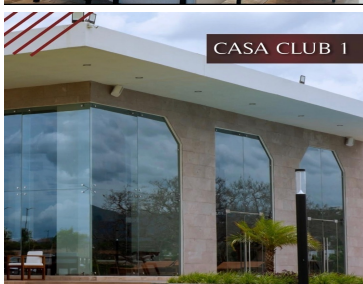
CASA CLUB 1