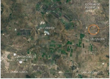
Fig. 01 Vista satelital del terreno