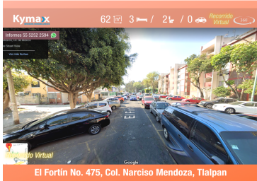
El Fortín No. 475, Col. Narciso Mendoza, Tlalpan

Documentación en regla, libre de gravamen y sin adeudos. Solo para escritura. Se aceptan créditos Bancarios e Infonavit (de ser necesario)