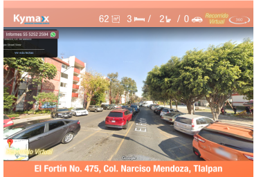
El Fortín No. 475, Col. Narciso Mendoza, Tlalpan

Documentación en regla, libre de gravamen y sin adeudos. Solo para escritura. Se aceptan créditos Bancarios e Infonavit (de ser necesario)