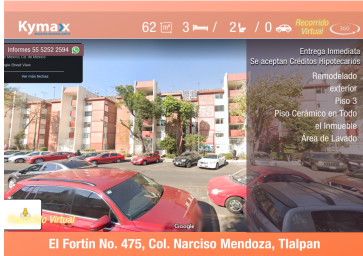
El Fortín No. 475, Col. Narciso Mendoza, Tlalpan

Documentación en regla, libre de gravamen y sin adeudos. Solo para escritura. Se aceptan créditos Bancarios e Infonavit (de ser necesario)