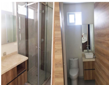
LOFT Y PENHOUSE DE 135 MTS 2 2 RECÁMARAS, 2 BAÑOS, TERRAZA, ESTANCIA, RECÁMARA PRINCIPAL CON VESTIDOR