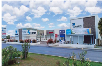
Local 3 Interior