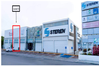
Ubicación del local