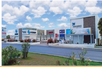
Local 3 Interior