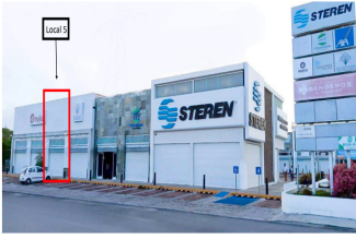
Ubicación del local