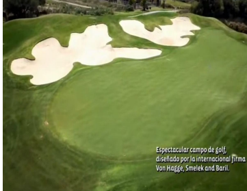
Espectacular campo de golf, diseñado por la internacional firma Von Hage, Smelek and Bari.