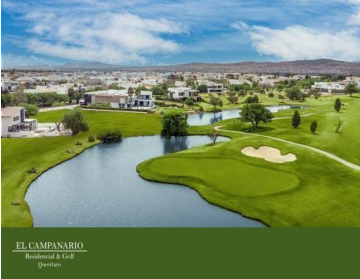
EL CAMPANARIO Residencial & Golf Querétaro