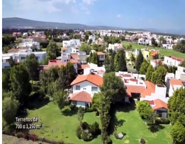
Terrenos de 700 a 1,250 m 2