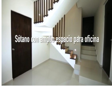
Sótano con amplio espacio para oficina