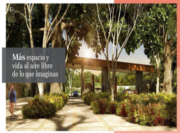
Más espacio y vida al aire libre de lo que imaginas