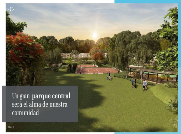
Un gran parque central será el alma de nuestra comunidad