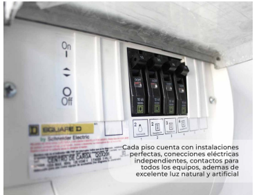
Cada piso cuenta con instalaciones perfectas, conexiones eléctricas independientes, contactos para todos los equipos, además de excelente luz natural y artificial