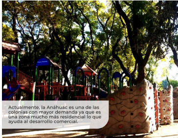
Actualmente, la Anáhuac es una de las colonias con mayor demanda ya que es una zona mucho más residencial lo que ayuda al desarrollo comercial.