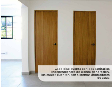
Cada piso cuenta con dos sanitarios independientes de última generación, los cuales cuentan con sistemas ahorradores de agua