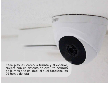
Cada piso, así como la terraza y el exterior, cuenta con un sistema de circuito cerrado de la más alta calidad, el cual funciona las 24 horas del día.