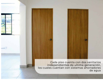
Cada piso cuenta con dos sanitarios independientes de última generación, los cuales cuentan con sistemas ahorradores de agua