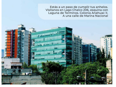
Estás a un paso de cumplir tus anhelos. Visítanos en Lago Chalco 206, esquina con Laguna de Terminos, Colonia Anáhuac II. A una calle de Marina Nacional