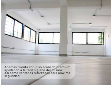
Además cuenta con piso acabado premium, ayudando a la fácil higiene del mismo. Así como ventanas reforzadas para máxima seguridad