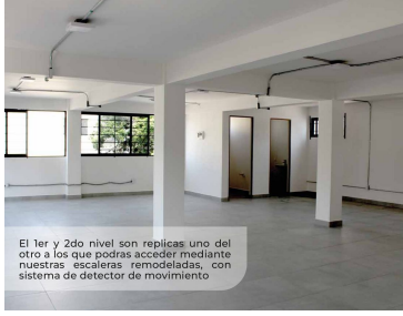
El 1er y 2do nivel son replicas uno del otro a los que podrás acceder mediante nuestras escaleras remodeladas, con sistema de detector de movimiento