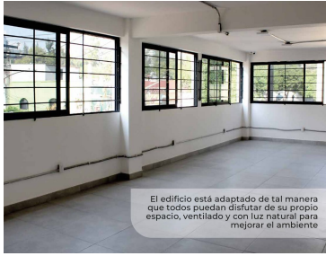
El edificio está adaptado de tal manera que todos puedan disfrutar de su propio espacio, ventilado y con luz natural para mejorar el ambiente