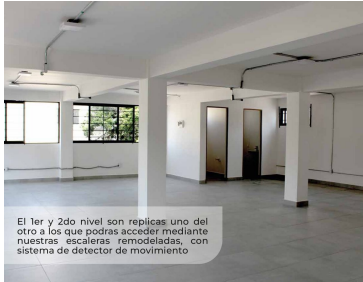
El 1er y 2do nivel son replicas uno del otro a los que podrás acceder mediante nuestras escaleras remodeladas, con sistema de detector de movimiento