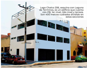
Lago Chalco 206, esquina con Laguna de Terminos, es un edificio que cuenta con PB, 1er nivel, 2do nivel y terraza. Son 400 metros cuadrados dividido en estas secciones