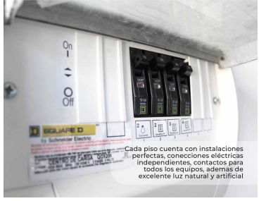
Cada piso cuenta con instalaciones perfectas, conexiones eléctricas independientes, contactos para todos los equipos, además de excelente luz natural y artificial