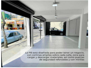
La PB está diseñada para poder tener un negocio, con cortinas amplias sobre cada calle, zona para cargar y descargar materiales, así como puertas de seguridad reforzadas y con mirtillas