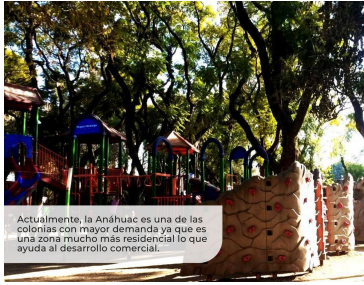
Actualmente, la Anáhuac es una de las colonias con mayor demanda ya que es una zona mucho más residencial lo que ayuda al desarrollo comercial.