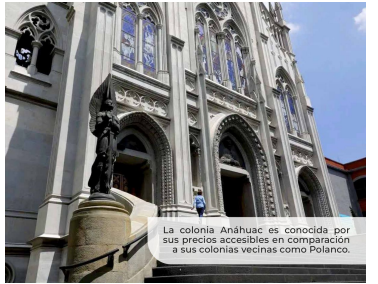
La colonia Anáhuac es conocida por sus precios accesibles en comparación a sus colonias vecinas como Polanco.

VIVE TUS SUEÑOS Descubre la nueva forma en la que puedes emprender tus más grandes sueños y proyectos. Todos aquellos que siempre buscaste, ahora al alcance de tus manos, a unos cuantos metros de la torre de Pemex