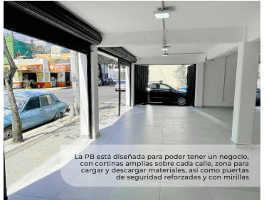
La PB está diseñada para poder tener un negocio, con cortinas amplias sobre cada calle, zona para cargar y descargar materiales, así como puertas de seguridad reforzadas y con mirtillas