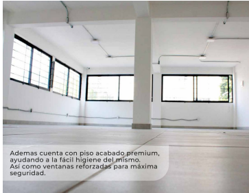
Además cuenta con piso acabado premium, ayudando a la fácil higiene del mismo. Así como ventanas reforzadas para máxima seguridad