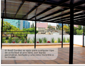
El Roof Garden es apto para cualquier tipo de actividad al aire libre, con barda perimetral, techado y una vista increíble a la ciudad.