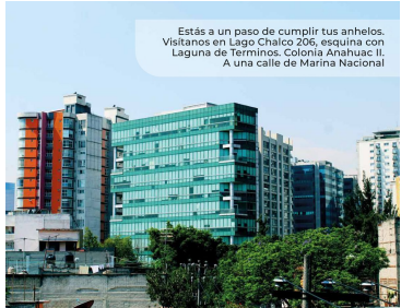
Estás a un paso de cumplir tus anhelos. Visítanos en Lago Chalco 206, esquina con Laguna de Terminos, Colonia Anáhuac II. A una calle de Marina Nacional