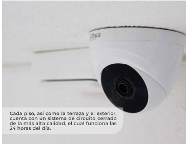
Cada piso, así como la terraza y el exterior, cuenta con un sistema de circuito cerrado de la más alta calidad, el cual funciona las 24 horas del día.