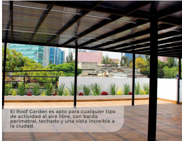
El Roof Garden es apto para cualquier tipo de actividad al aire libre, con barda perimetral, techado y una vista increíble a la ciudad.