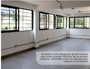
El edificio está adaptado de tal manera que todos puedan disfrutar de su propio espacio, ventilado y con luz natural para mejorar el ambiente