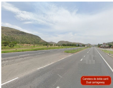
Carretera de doble carril Dual carriageway