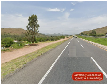
Carretera y alrededores Highway & surroundings