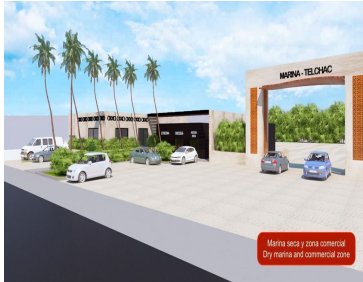
Marina seca y zona comercial Dry marina and commercial zone