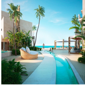
Casa Vista al mar Ocean view House