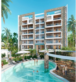
Áreas comunes Common areas