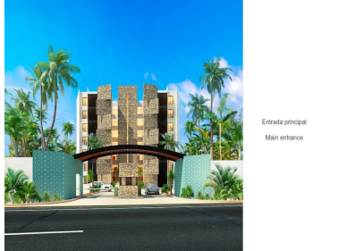
Entrada principal Main entrance