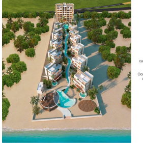
Desarrollo de casas y departamentos frente al mar Ocean front development of condos & houses