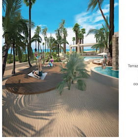
Terraza de usos multiples frente al mar Multiple uses ocean front terrace