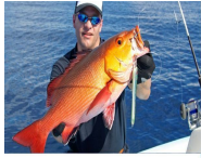
Gold Fish Pez Dorado