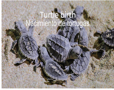
Turtle birth Nacimiento de tortugas