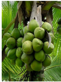
Plantacion de cocos (Alrededor de 12,000 cocos cada 3 meses) Coconut orchard (around 12 thousand coconuts every 3 months)