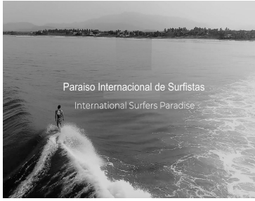
Paraiso Internacional de Surfistas International Surfers Paradise