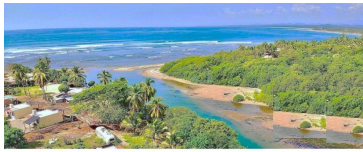
Playa a 2 cuerpos de agua In front of 2 bodies of water