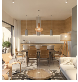
Cocina integral diseño abierto Built in kitchen open design