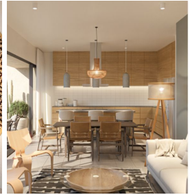
Cocina integral diseño abierto Built in kitchen open design