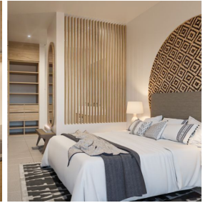
Recamaras con baño privado Bedrooms with private bathroom