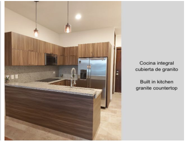
Cocina integral cubierta de granito Built in kitchen granite countertop