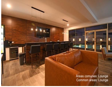
Areas comunes: Lounge Common areas: Lounge