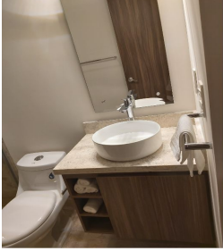
Baño con todos los accesorios Bathroom with all accessories