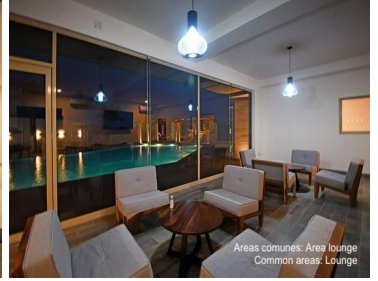
Areas comunes: Area lounge Common areas: Lounge