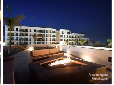
Area de fogata Fire pit zone