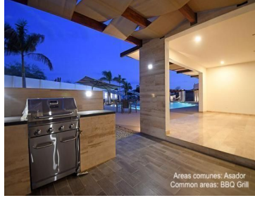
Areas comunes: Asador Common areas: BBQ Grill