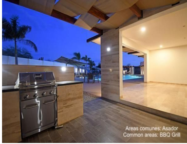
Areas comunes: Asador Common areas: BBQ Grill