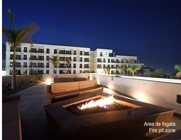
Area de fogata Fire pit zone