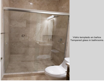
Vidrio templado en baños Tempered glass in bathrooms