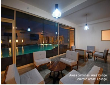
Areas comunes: Area lounge Common areas: Lounge