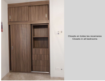
Closets en todas las recamaras Closets in all bedrooms