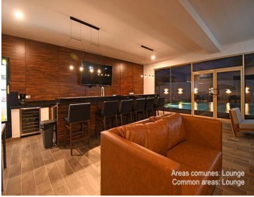
Areas comunes: Lounge Common areas: Lounge