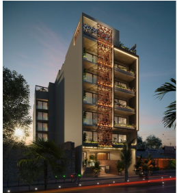
Fachada de noche Facade by night