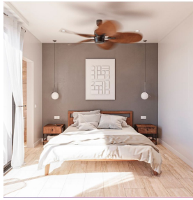
Recamara ventana de piso a techo Bedroom floor to ceiling window