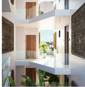
Pasillo interior con ventilación Indoor hall with ventilation