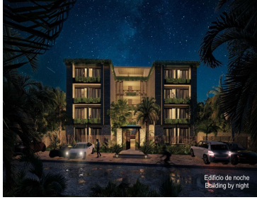
Edificio de noche Building by night