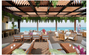
Terraza con semi sombra y vista al mar Ocean view semi shaded terrace