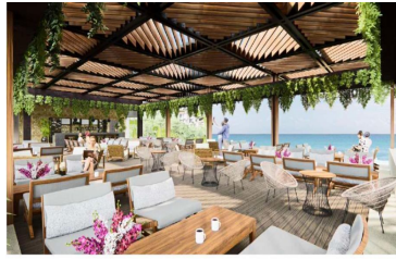
Terraza con vista al mar Ocean view terrace