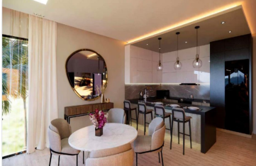
Cocina con diseño abierto Open design kitchen