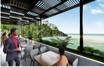
Terraza con vista al mar Ocean view terrace