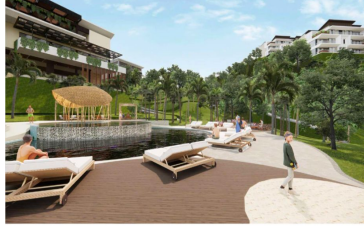
Club de playa Beach club