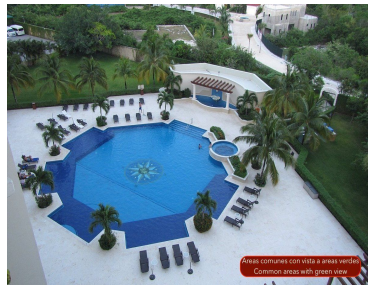
Áreas comunes con vista a áreas verdes Common areas with green view