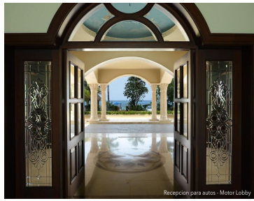
Recepcion para autos - Motor Lobby