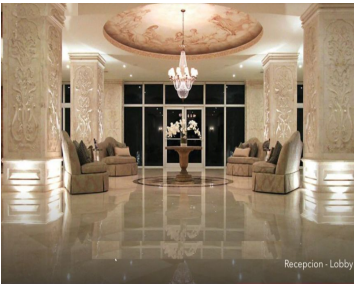
Recepcion - Lobby