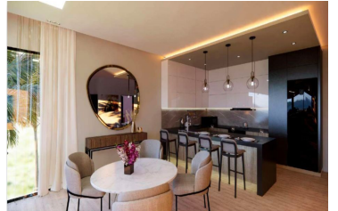
Cocina con diseño abierto Open design kitchen