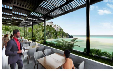
Terraza con vista al mar Ocean view terrace