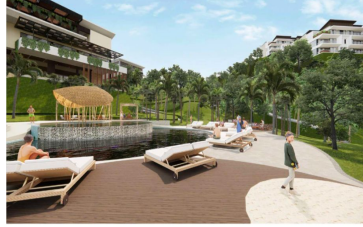
Club de playa Beach club