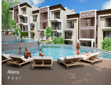
Alberca P o o l