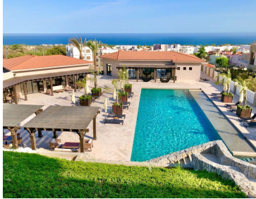
Casa Club Club House