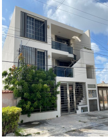
1 departamento por piso 1 apartment per floor