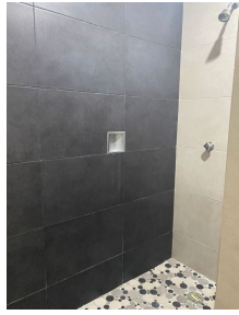
Baño con cubierta ceramica Bathroom with ceramic cover