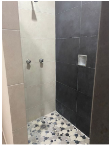
Ragadera espaciosa con cubierta de ceramica Spacious shower ceramic covered