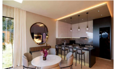
Cocina con diseño abierto Open design kitchen