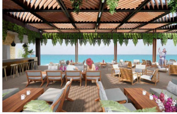
Terraza con semi sombra y vista al mar Ocean view semi shaded terrace