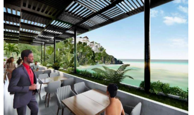
Terraza con vista al mar Ocean view terrace