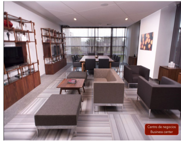
Centro de negocios Business center