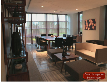
Centro de negocios Business room