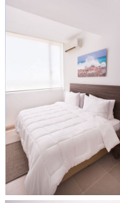
Ventanas amplias, recamaras iluminadas Wide windows in bedrooms, natural light