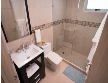
Main bedroom with closet and private bathroom