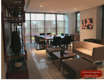
Centro de negocios Business center