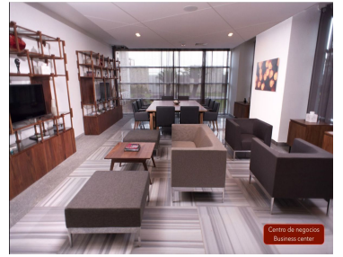
Centro de negocios Business center