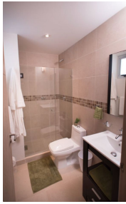
Baños con cubierta cerámica y cristal templado