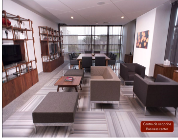
Centro de negocios Business center