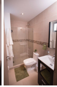
Baños con cubierta cerámica y cristal templado Bathroom with ceramic cover and tempered glass