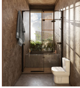
Baño con ventana amplia Bathroom with wide window